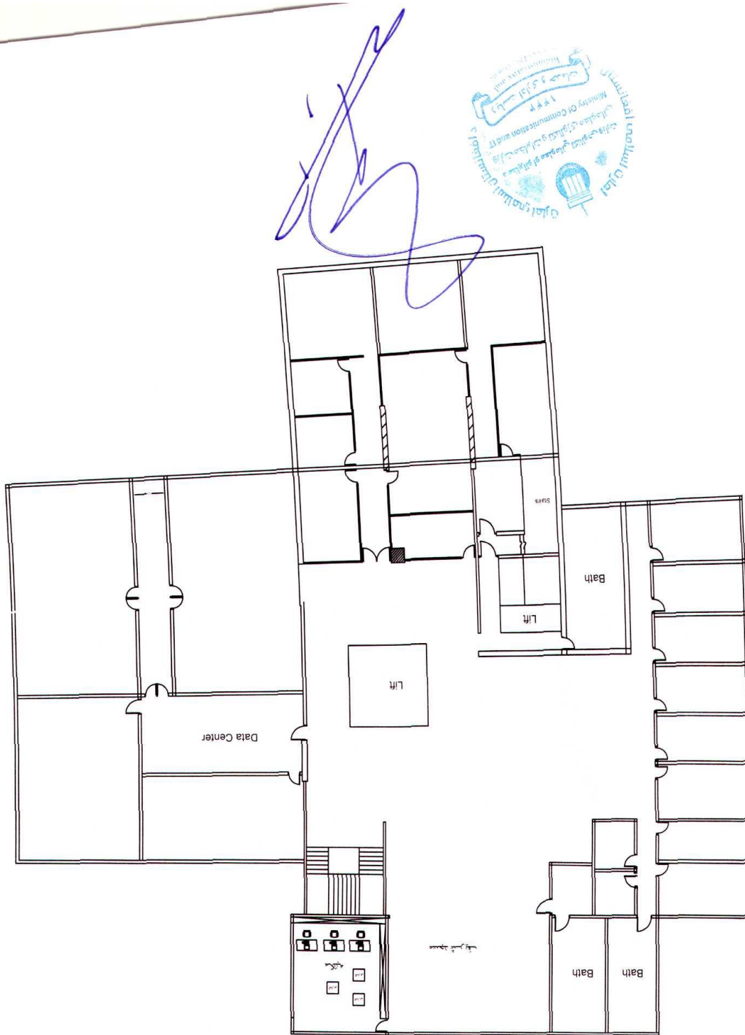
MCIT First Floor Plan