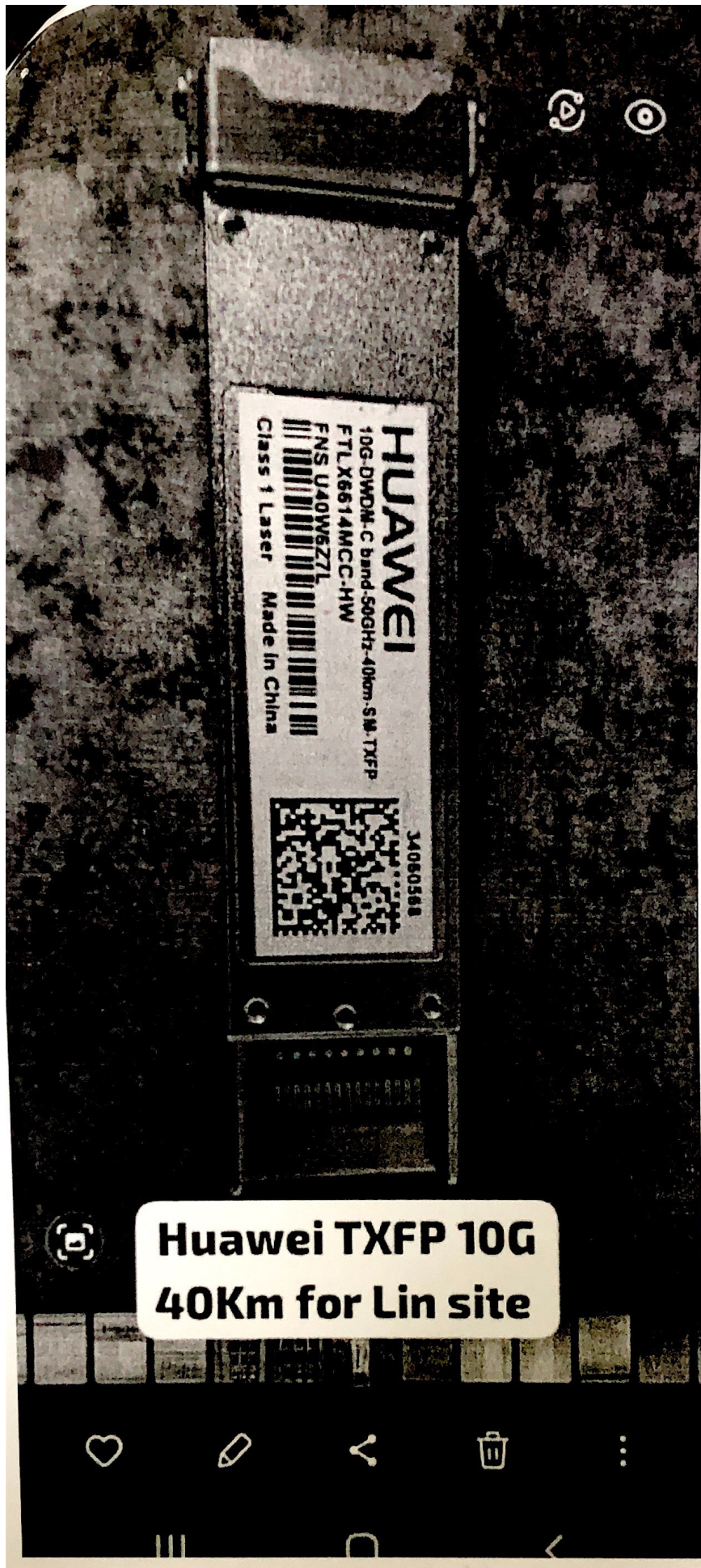
Huawei TXFP 10G 40Km for Lin site