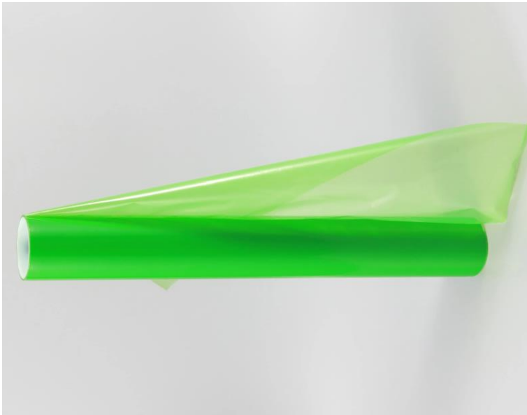
پلاستیک مخصوص گرین