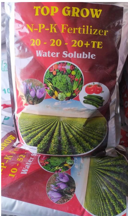
کود کیمیای 20-20