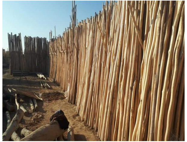
چوب ۳ و ۲ اینچ به طول ۴ متر