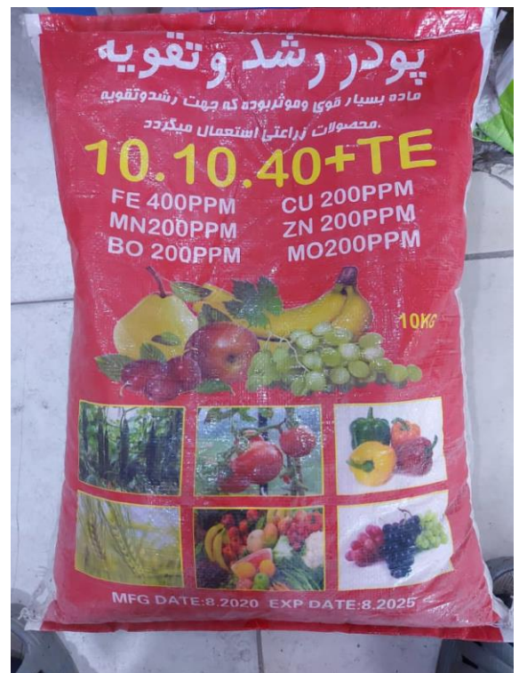
کود کیمیای پتاشیم