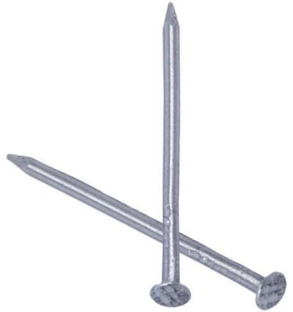
ميخ ۲ و ۳ اينچ